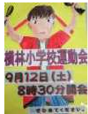
(6年生の制作ポスター)