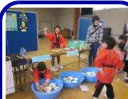
いろいろ すくい屋さん