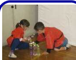
魔法の ボーリング屋