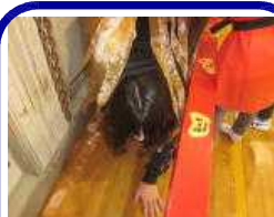
ハロウィン おばけパレード