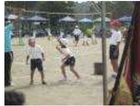
<役者にへ〜んしん1、2年> <世界に一つだけの花1〜3年>