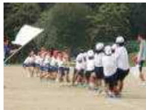
<応援綱引き 全学年> <よさこいソーラン4〜6年>