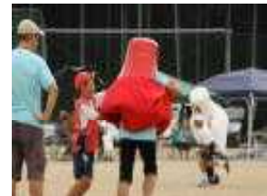
<紅白だるま運び1〜3年親子>