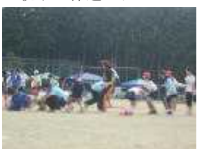
<親子で棒運びリレー4〜6年親子> <全校リレー>